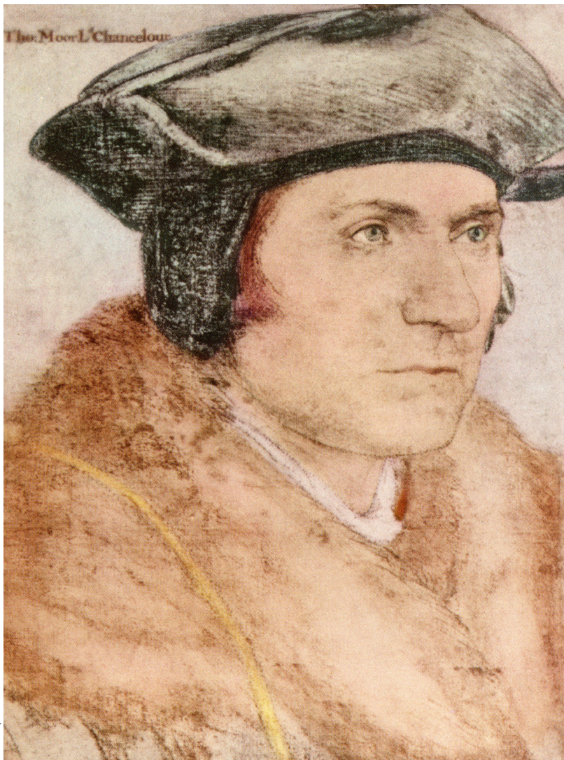
Syr Thomas More, a ddiwyddiwr am frad yn 1535

Ar yr un pryd, roedd Harri'n gwbl benderfynol o ddod ag Eglwys Loegr dan reolaeth frenhinol. Ar y dechrau doedd hyn ddim yn anodd ei gyflawni, a sicrhawyd llawer o'r hyn yr oedd Harri am ei wneud gyda chymorth Thomas Wolsey, oedd yn Gardinal, Archesgob Caerefrog a legad y Pab. Wolsey oedd yn rheoli'r eglwys, a Harri oedd yn rheoli Wolsey. Pan gododd storm dros gwmpas annibyniaeth glerigol yn Lloegr, eglurodd Harri ei safbwynt yn glir. 'Ni yw Brenin Lloegr, ac yn y gorffennol nid oes neb wedi bod yn uwch na Brenhinoedd Lloegr ond am Dduw ei hun. O ganlyniad, bydded hysbys y byddem ni yn cadw hawl ein Coron a'n hawdurdodaeth yn y byd, ar y pwynt hwn yn ogystal â phob un arall, mewn modd yr un mor eang ag y gwnaeth unrhyw un o'n hynafiaid cyn ein hamser ni.' Mae'r datganiad hwn yn dangos nid yn unig bod Harri yn benderfynol o reoli'r Eglwys, ond ei fod hefyd yn ystyried hyn yn hawl hynafol a hynafiadol. Rhagwelwyd iaith Goruchafiaeth Frenhinol bron ugain mlynedd cyn iddi gyflawni ei ffurf derfynol.