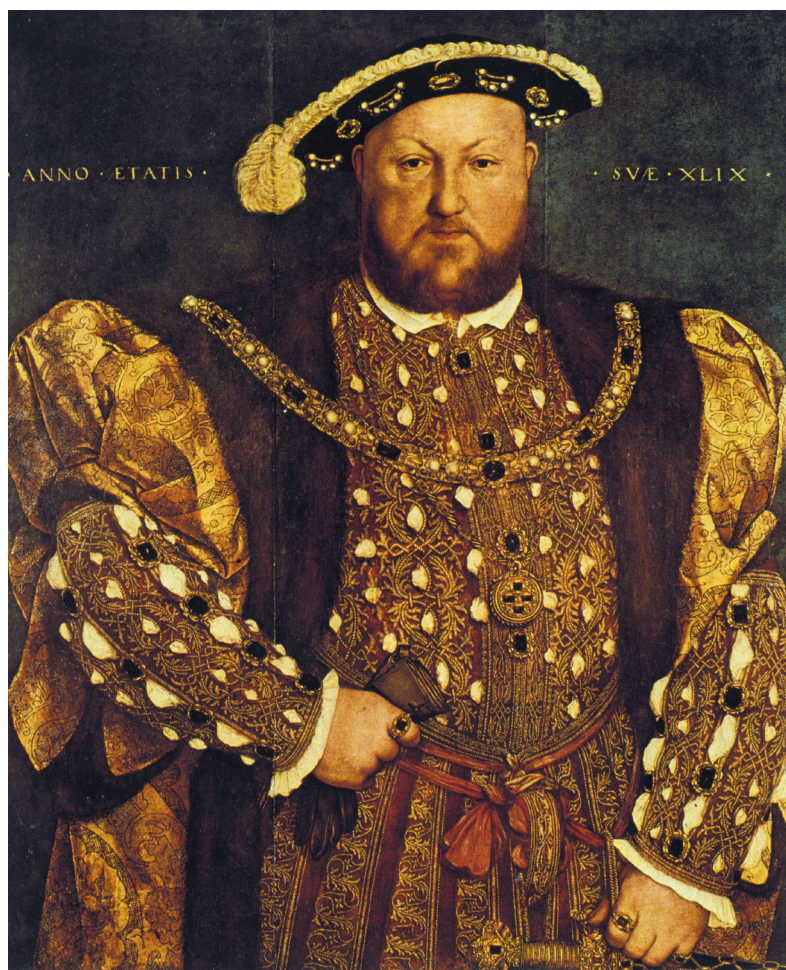
Harri'r VIII, brenin Lloegr 1509-1547

Roedd crefydd Harri yn ddirgelwch i'w gyfoedion, ac mae wedi parhau'n destun dadl byth ers hynny. Y broblem yw fod ei deyrnasiad yn cyd-fynd â dechrau'r hyn a alwyd wedi hynny yn Ddiwygiad Seisnig. Roedd gweithredoedd Harri megis torri ei gysylltiad â Rhufain, sefydlu'r Oruchafiaeth Frenhinol, cyflwyno'r Beibl Saesneg a diddymu'r mynachlogydd oll yn gamau ar y llwybr at ddyfodol Protestannaidd Lloegr. Y cwestiwn yw a oedd Harri ei hun yn ymwybodol o hyn, ac a oedd yn bwriadu i hyn ddigwydd. Mae ein dealltwriaeth ni o'r brenin a'n dealltwriaeth o'r Diwygiad