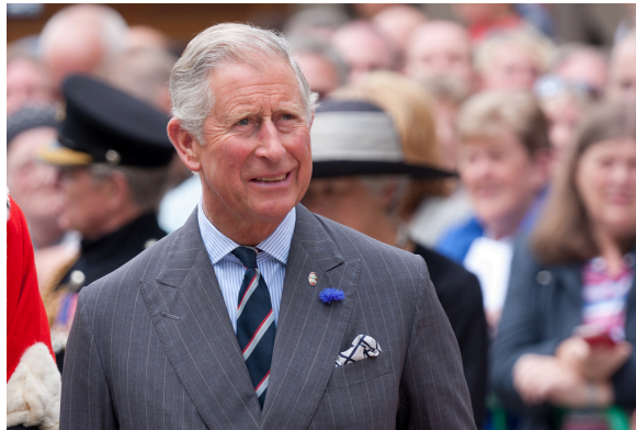
Mae Tywysog Cymru yn mwynhau Fern Hill gan Dylan

Gwrandewch a darllen am ei recordiad yn www.walesonline.co.uk/whats-on/dylathon-listen-prince-charles-reading-8005287