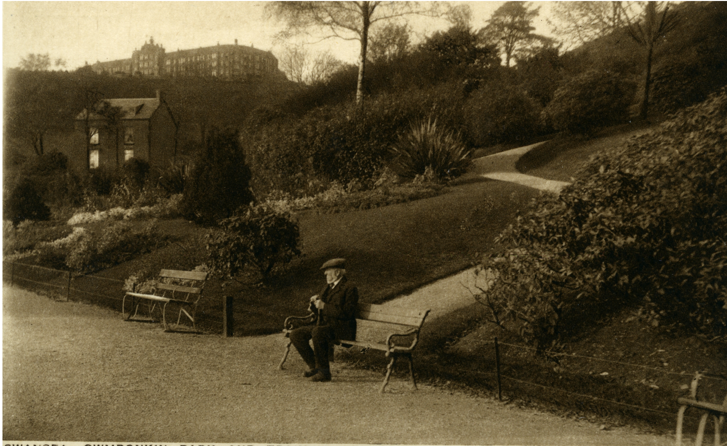
SWANSEA, CWMDONKIN PARK AND TRAINING COLLEGE